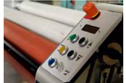
▲オペレーターの目線で設計された操作しやすいコントロールパネル