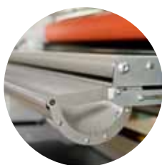
■直径18mmまで置けるテーブルトレイ