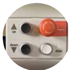
■後部にも配置された操作パネル