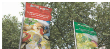
ソフトサイネージ