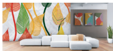
壁紙、およびキャンバス