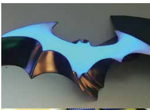
↑こんな特殊形状のチャンネル文字も Massivit ならではです!