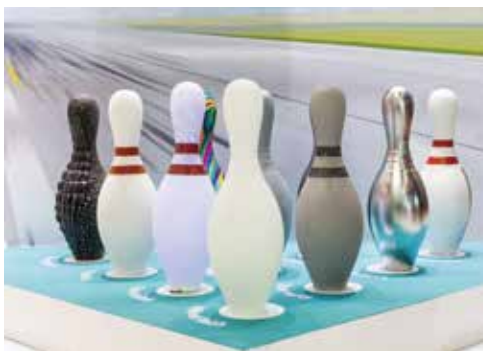
様々な後加工を施すことで、同じ造形物も色んな仕上がりになります!!