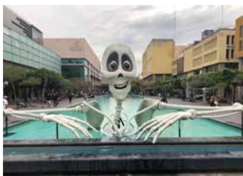
ワイド 10M 以上の造形物もつなぎ合わせることで制作可能です。