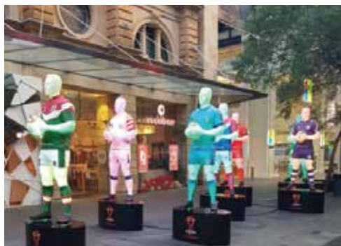
材料のゲルが透過性能をもっているため、電飾の造形物の制作もできます!