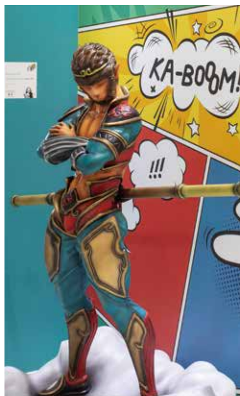
フィギュア並みに細かいディテールまで再現されています。