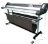
出展機種: オートトリマー-ET1600

新商品のオートトリマーを出品致します。IJメディア、マーキングフィルム、ターボリン等のカット作業が簡単、安全になります。ボード用の刃に交換して頂く事により7mm厚迄の発泡ボードも対応。(刃の交換はユーザー様ご自身で簡単に行えます。)