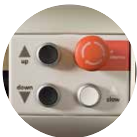
■後部にも配置された操作パネル