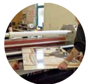
■両手がフリーとなるフットスイッチ