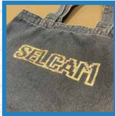
デニムトート コットン100% インディゴ染料系染