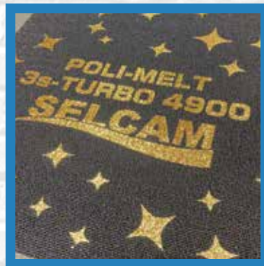
タイルカーペット ポリプロピレン100%