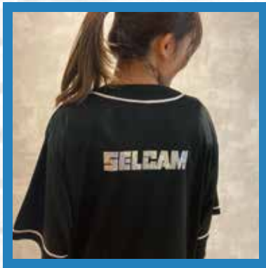
ベースボールシャツ ポリエステル100%