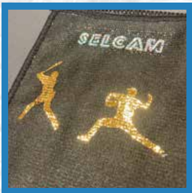
昇華プリントタオル ポリエステル100% プリント済みの上に箔押し