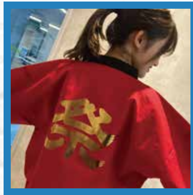
法被 コットン100% 天竺織生地