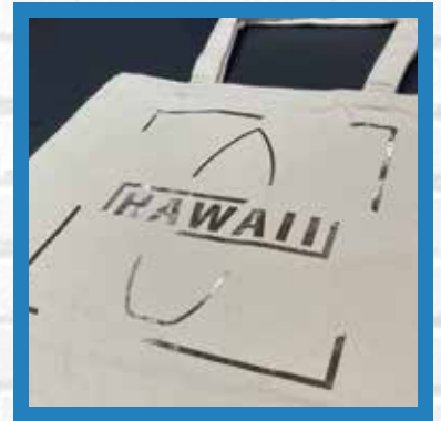
トートバック コットン100% キャンバス生地