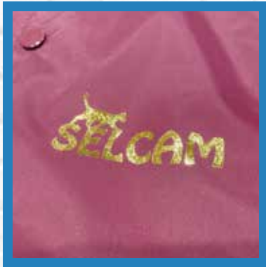
コーチジャケット ナイロン100% サテン織生地