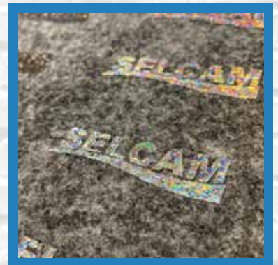
ポリエステル ポリエステル100%