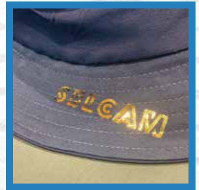
バケットハット ナイロン100% タスラン加工生地