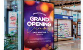
バックライトがONでもOFFでも綺麗に見える内照看板