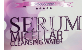
バーニッシュインクによる加飾