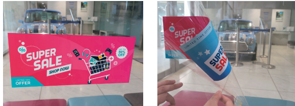
表と裏で異なるデザインの印刷に

2層・3層 ホワイトやバーニッシュ加飾による多彩な印刷表現 ウィンドウグラフィックスや内照看板の印刷に