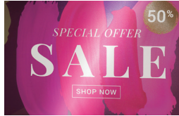
メタリック用紙や透明フィルムに印刷

2層・3層 ホワイトやバーニッシュ加飾による多彩な印刷表現 ウィンドウグラフィックスや内照看板の印刷に